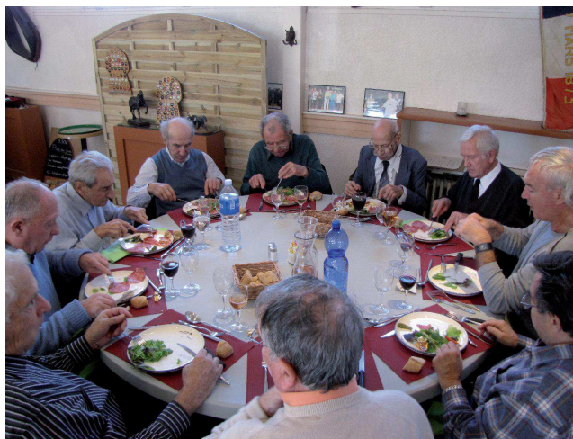
Un bon coup de fourchette