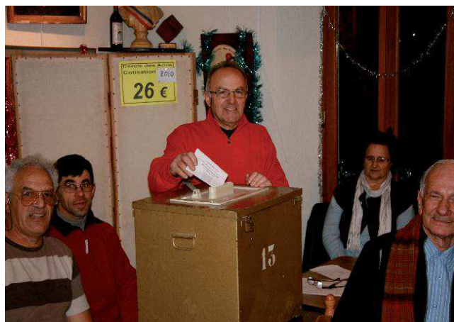
AG, le président scrute...