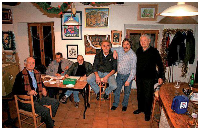
...et là on discute