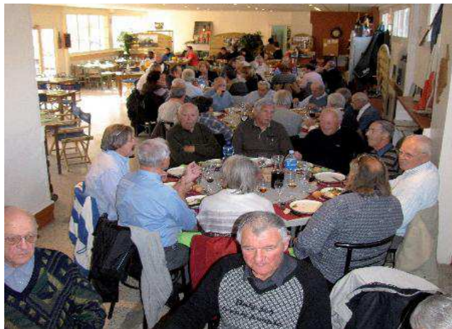
repas des anciens : vue de la salle

le site internet cercleamis.cagnes.free.fr